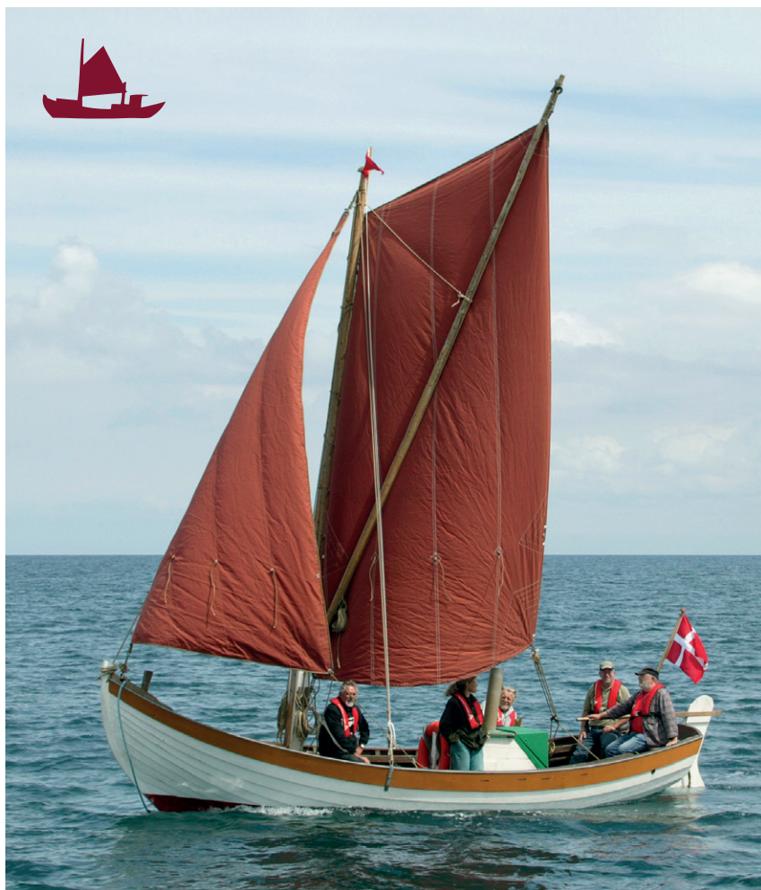
Foreningens første nybygning, Elbo, der er bygget efter den gamle Elbo fra 1919.