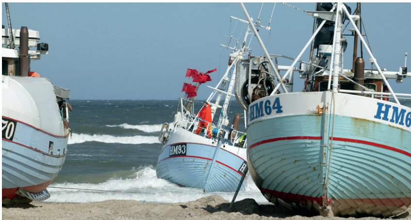
Fra Thorupstrand i Han Herred drives der moderne kystfiskeri direkte fra stranden.

Han Herred Havbåde blev dannet i Lild Strand, Thorupstrand og Slettestrand i 2007. Formålet er at anvende og videreudvikle bygning og brug af havbåde på den åbne strands landingspladser samt de kulturmiljøer, der hører kystkulturen til.