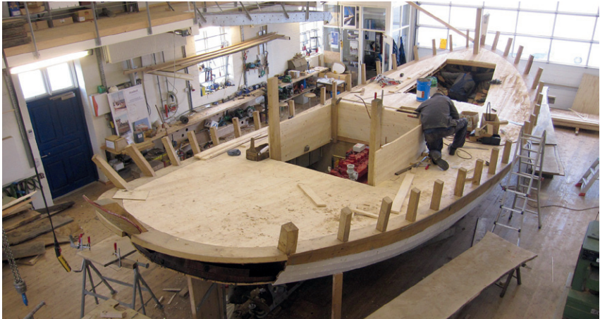
Foreningens første renovering – havbåden Nordvest fra 1962 – i det nye bådewærft.

Bådebyggeriet betjener såvel Han Herred Havbådes egne skibe som på sigt kystfiskeriets træbåde og de havbåde, hvormed der drives tursejlsads med gæster.