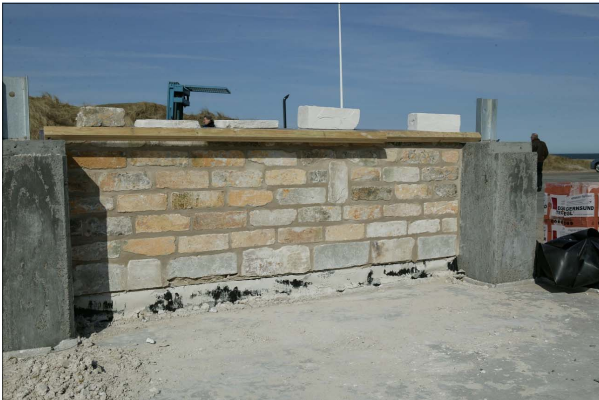
Limstenene har mange spor – på disse kan man tydelig se den gamle, gule kalk.

spor efter kalk eller maling, og enkelte har siddet ved et ildsted. Nogle af stenene fra vognhuset i Vust har et indridset tal på den flade side. Flere af disse sten bliver muret ind i væggene på højkant, så man kan se tallet. Hvorfor de er nummereret, står hen i det uvisse, men måske er der nogen, der kan komme med en forklaring?