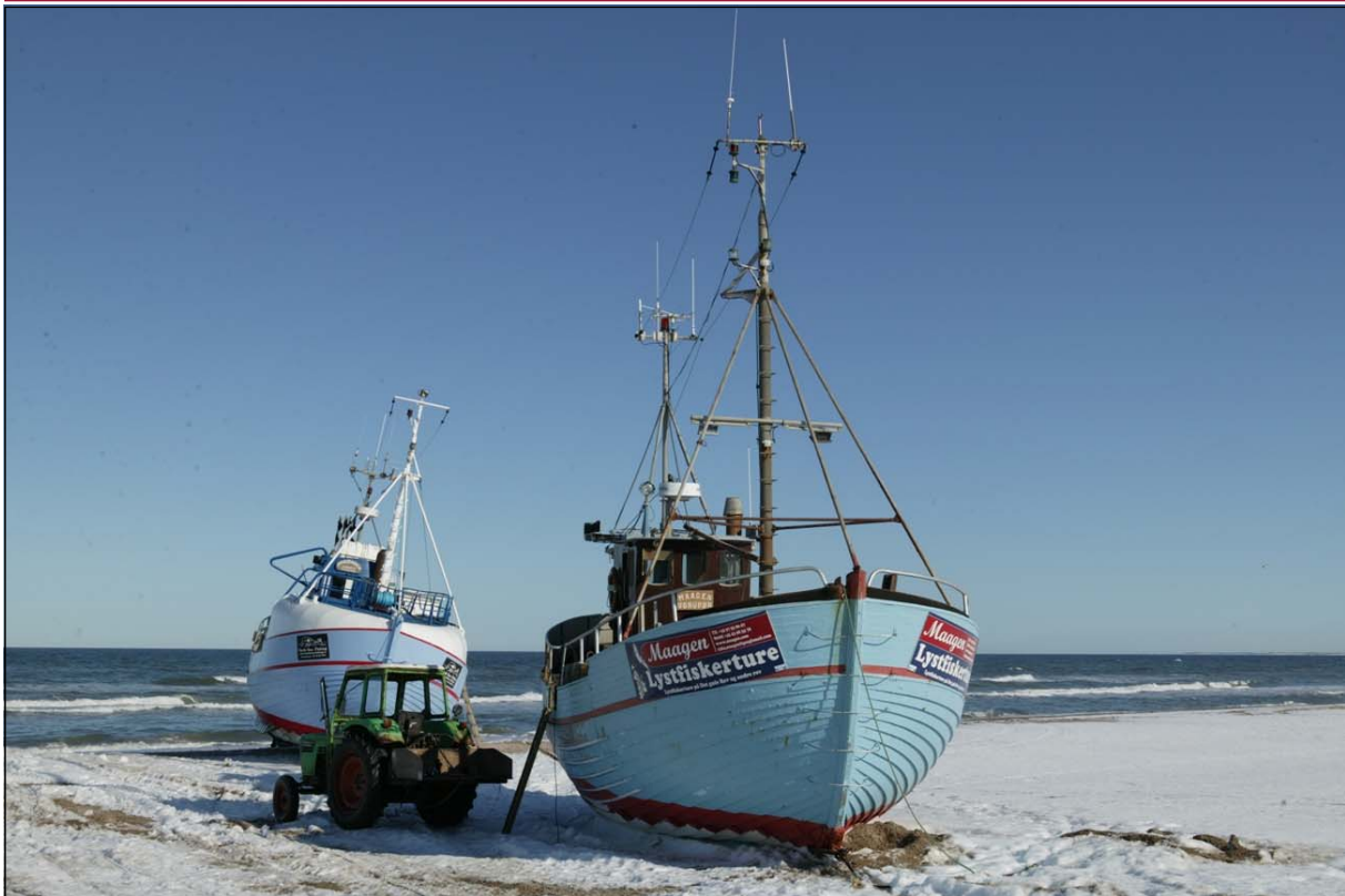
Peter og Freddy har i vinter brugt en del tid på Maagen af Vorupør, der skulle rigges om til at sejle med lystfiskere.