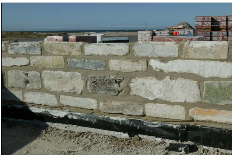
Bemærk den lange limsten med de tydelige spor af øksehuggene.