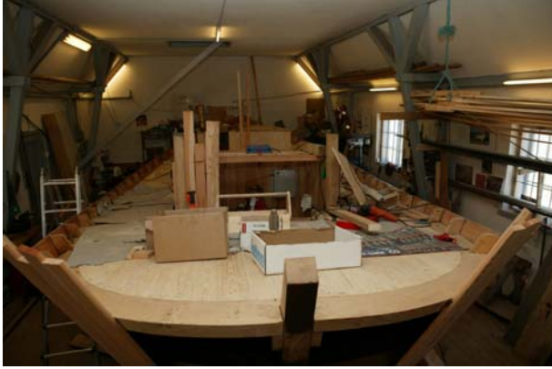
Jammerbugt agten fra ...