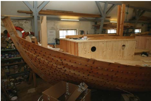
... og fra stævnen.