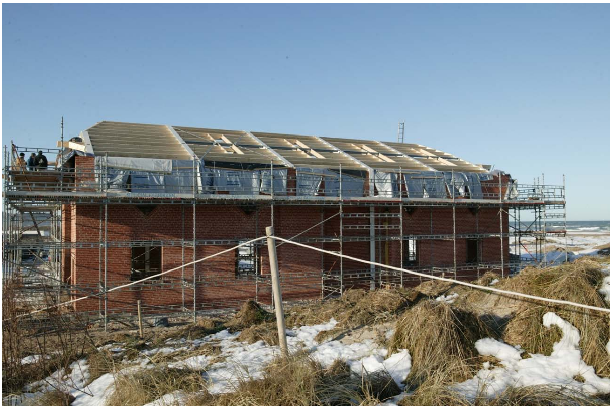
Frost og vintervejr har sat en alvorlig bremse for byggeriet af det nye bådeværft i Slettestrand. Østfacaden er muret op, mens der mangler lidt i vest samt øverst i begge gavle.