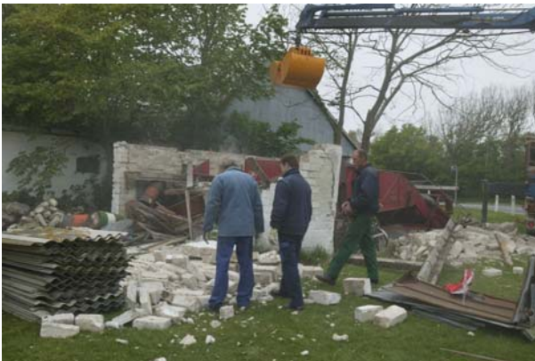
Vognhusets tag er fjernet.