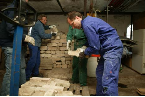
Ved Lund Fjord fik havbådene foræret en stor stak limsten, der var pillet ned for mange år siden.