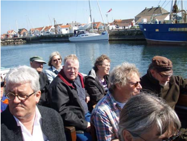
Sejlads i kanalhavnen i Løgstør under medlemsudflugten lørdag 25. april.