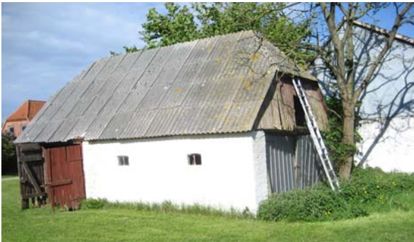
Limstenene i vognhuset er flyttet fra et hus, der blev revet ned ved Valbjerg for omkring 100 år siden. Når stenene bliver brugt i havbådehuset, er det således (mindst) tredje gang, de bliver anvendt.