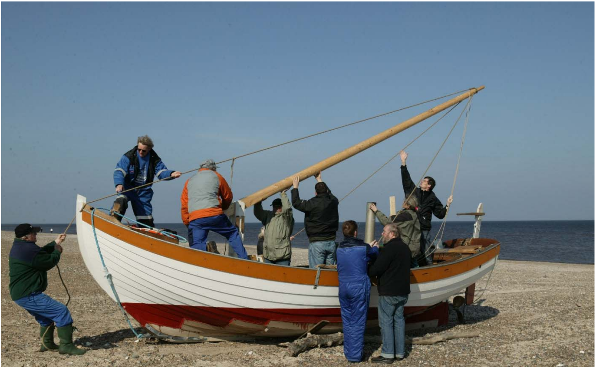
Elbos mast lægges ned. Det var almindeligt, at man lagde masten ned, når man ikke sejlede med sejl og var ude at fiske.