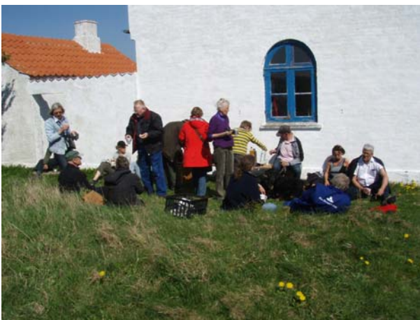
Kaffe ved kanalbetjenthuse i Lendrup.