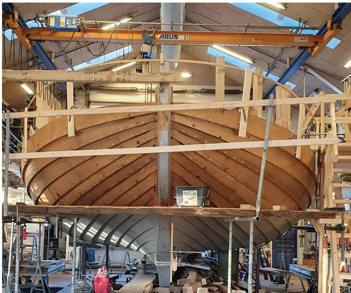
Med støtterne sat op, kan man fornemme faconen og størrelsen af Otto.

Sparekasse, reg.nr. 9135 kontonr. 0000095133 eller via giro til netbank på: +73 <85934503>.