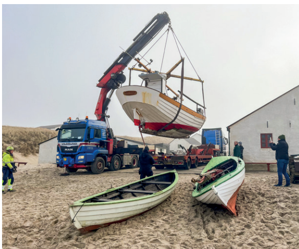
Jammerbugt højt til vejrs.