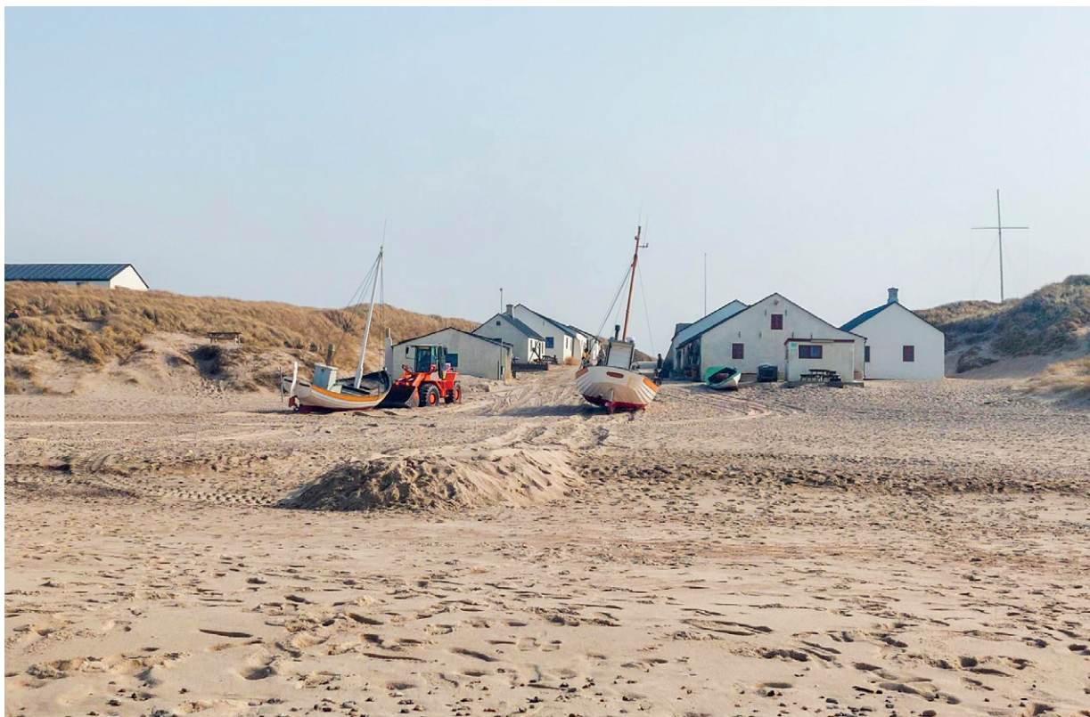
Elbo og Jammerbugt i Stenbjerg.