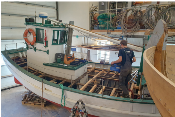
Det var ikke kun dækket, men også flere dæksbjælker, der skulle skiftes på Stjernen.