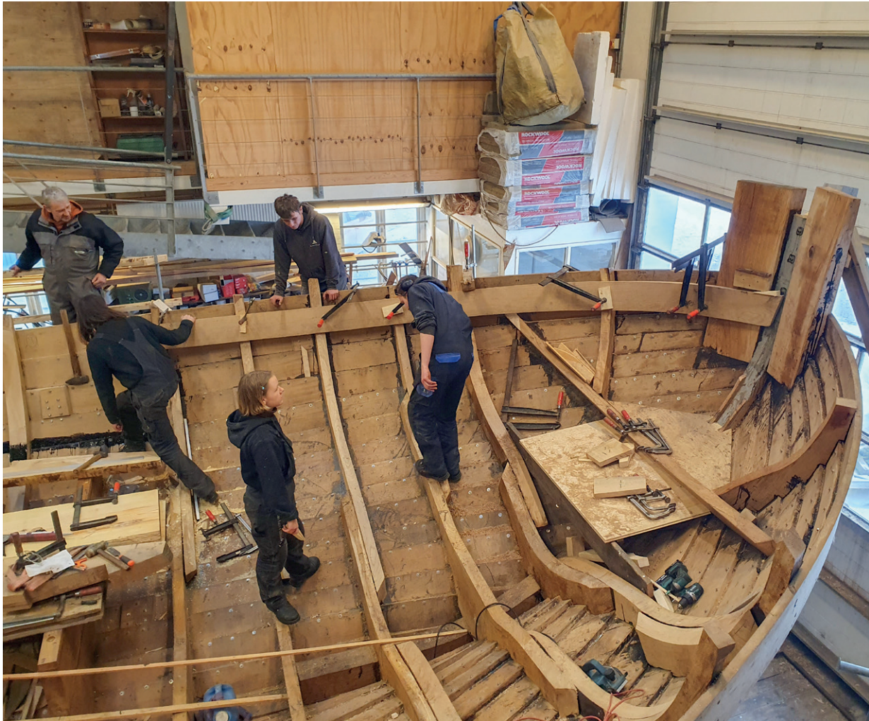
Bjelkevageren forrest i bagbord er lige sat op.

har også nogle gange svært ved at komme ud, fordi der konstant lægger sig sand, så vanddybden er meget lav. Det kan afhjælpes ved, at blokken bliver lagt længere ud, men så skal wirene være endnu længere. Allerede nu er blokken lagt længere ud flere gange. Derfor er bestyrelsen gået i gang med at søge om at flytte spilhuset og tårnet længere ud på stranden, så der igen er ca. 100 meter fra spilhuset til havstokken. I øjeblikket er der godt 230 meter. Efterfølgende skal der søges penge til projektet.