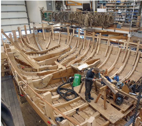
Her er støtterne sat op. Clara er i gang med en oplænger.