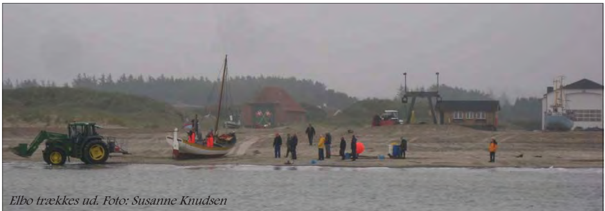
Elbo trækkes ud.

Alle skal have en stor tak for deres indsats!