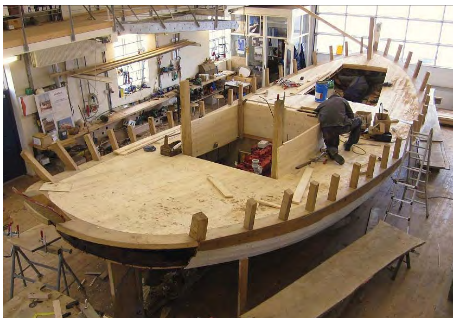
Peter i gang med motorruffet.