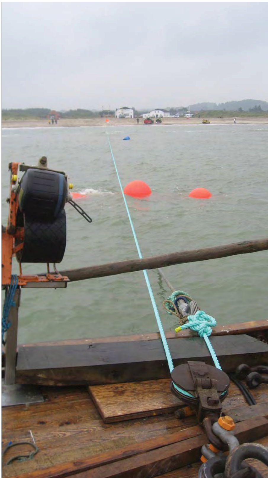
Blokken trækkes ud.