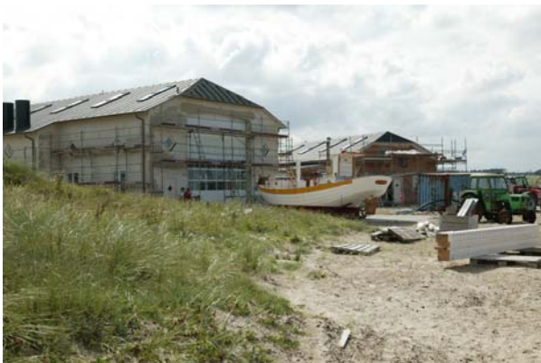
Byggeriet for godt et halvt år siden.

Lørdag 30. april er valgt til den officielle indvielse af Han Herred Havbådes nye faciliteter. Det er jo ingen hemmelighed, at