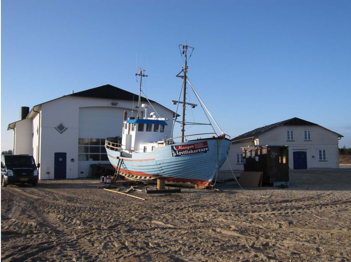
Det nye byggeri med »Maagen« foran med sit nye styrhus og dækshus.