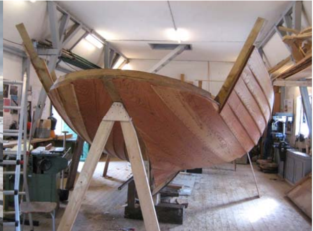
Færdig til dæk. Sådan så Jammerbugt ud, inden den fik slidbund på og løftet ned på gulvet.

Mandag 2. november ankom stålspærrene, og de første blev rejst. Resten blev rejst dagen efter, hvor det så var tid for rejsegilde om eftermiddagen kl. 15. Der mødte en del fiskere op fra Thorupstrand. Efterfølgende blev der serveret pølser og øl/sodavand. Det blæste koldt fra sydøst, og det begyndte også så småt at regne.