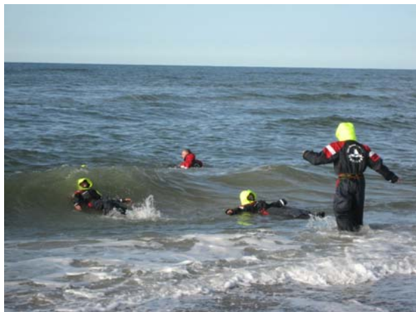
En solskinseftermiddag med let vind blev de nye dragter afprøvet ved Slettestrand. Det var koldt i begyndelsen, da vandet trængte ind, men det blev hurtigt opvarmet, og der var masser af opdrift i dragterne.

holde en person flydende i vandet, kan være, at de ikke er komfortable nok at arbejde i. De dragter, TrykFonden har sponsoreret, er både komfortable og lavet i et materiale, så kropstemperaturen kun synker med 1 grad pr. time i 3 grader varmt vand, forudsat at dragten er forsvarligt tillukket. Muligheden for at overleve en tur i vandet i de kolde måneder er selvfølgelig helt afhængig af, at kroppens temperatur ikke