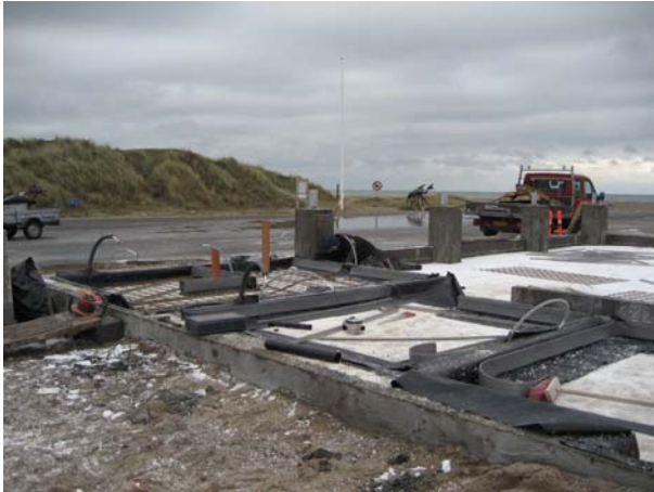
Den synlige tagkonstruktion skal hvile på betonsøjlerne i de store rum mod nordvest. Mod sydvest – til venstre i billedet – kommer der offentlige toiletter.