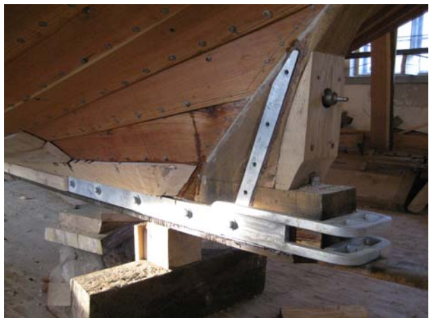
Kølskinnen og trækket agter er sat fast, ligesom skruceakslen er monteret på Jammerbugt.

Lørdag 5. september var der indkaldt til det før-