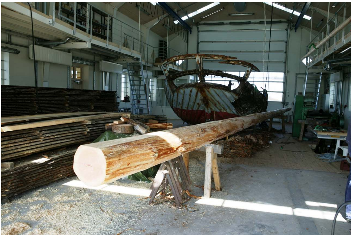
Ved siden af Nordvest er signalmasten ved at blive høvlet til. Bemærk råen til den, der hænger på gelænderet i højre øverste hjørne af billedet.