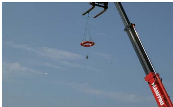
Redningskransen med ølflasken.

I øjeblikket ligger i Elbo i Limfjorden, så besætningen rigtig kan øve sig i at sejle med sejl.