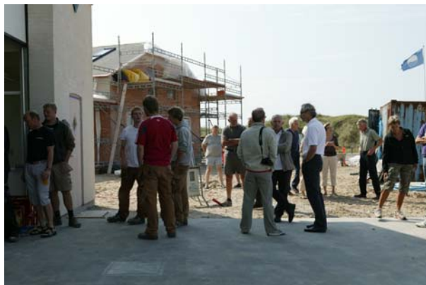
Servering af pølser og øl i værftet ved rejsegildet af havbådehuset.