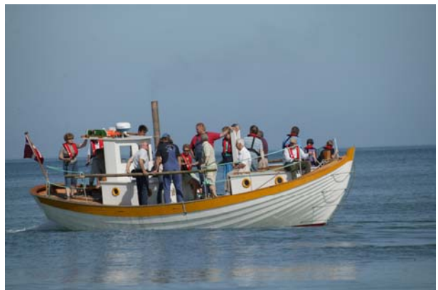
Jammerbugt på den første ud af de fem ture, der blev sejlet til søsætningen.

Jammerbugt er i øjeblikket trukket helt op til det nye bådeværft, for uheldigvis gik motoren i stykker for nogle uger siden. Den er nu sendt til Dansk Motorsamling i Grenaa, hvor man vil se på, om det er muligt at reparere den.