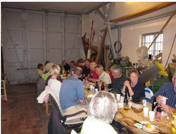
Sommerfest i redningshuset.

Der blev afholdt en velbesøgt sommerfest i redningshuset lørdag 14. august. Et par af de nye planker til Nordvest blev brugt som bord, og maden blev leveret fra Hanen i Fjerritslev.