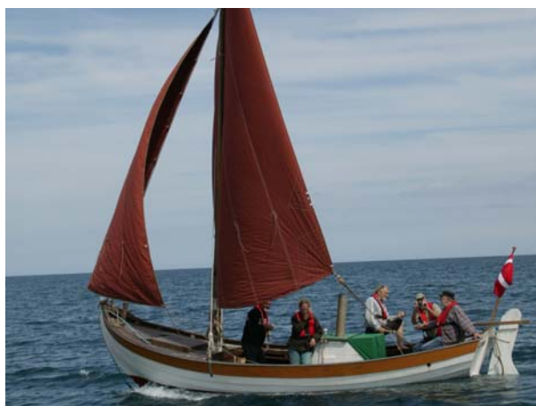
Elbo for sejl