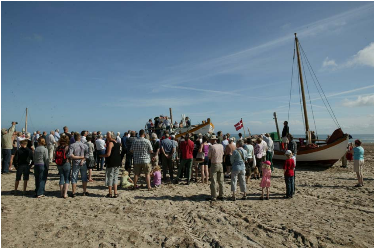
Omkring et par hundrede mennesker deltog i søsætningen af Jammerbugt.