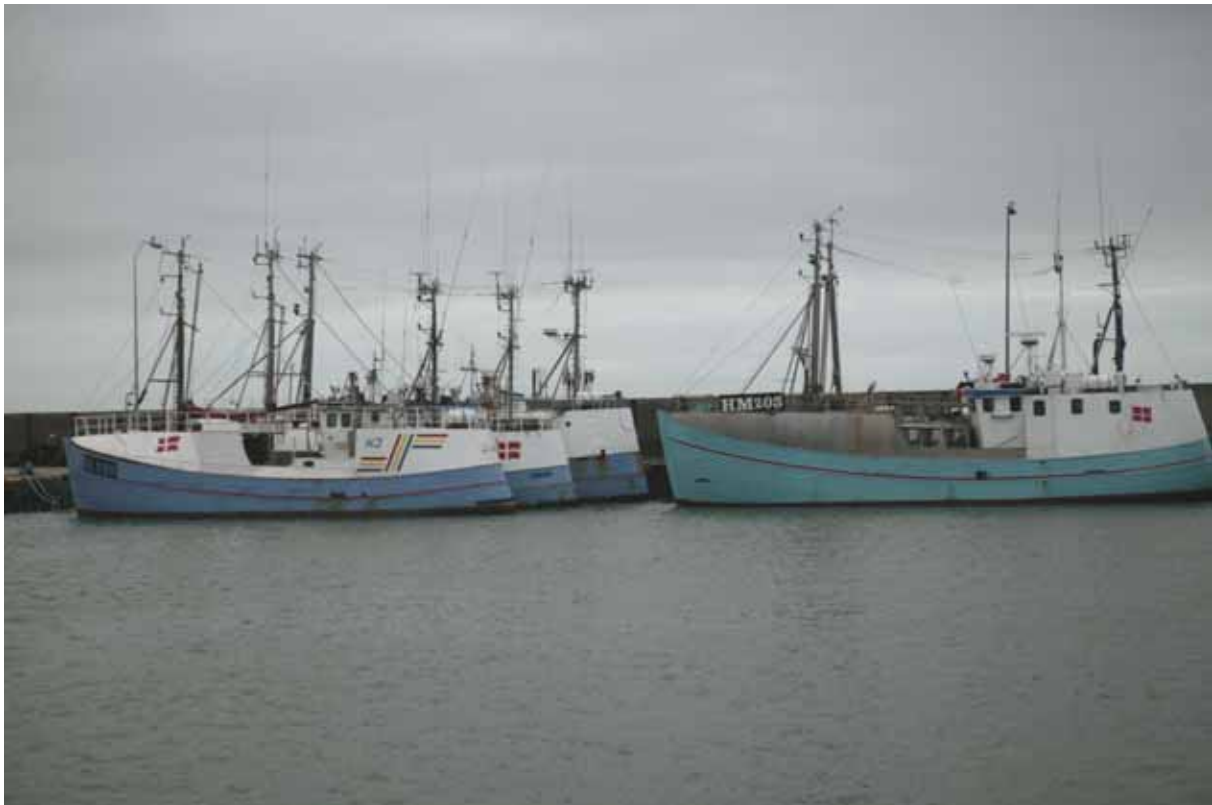
Garnbåde fra Hvide Sande hvis kvoter er købt til Han Herred

Krisen har over en lang årrække ramt kystfiskerne på grund af den voldsomme vækst i de store fartøjers fangstkapacitet, der har gjort stadig større indhug i fangstgrundlaget. De europæiske stater og EU har i årtier taget del i den globale kamp om havenes ressourcer ved at finansiere støtteordninger til bygning, modernisering og effektivisering af stadig større og mere energikrævende ståltrawlere. Danmark har satset kraftigt på moderniseringsstøtte for at fremme en "strukturnationalisering": Moderniseringsstøtte gik hånd i hånd med ophugningsstøtte til den eksisterende kutterflåde.