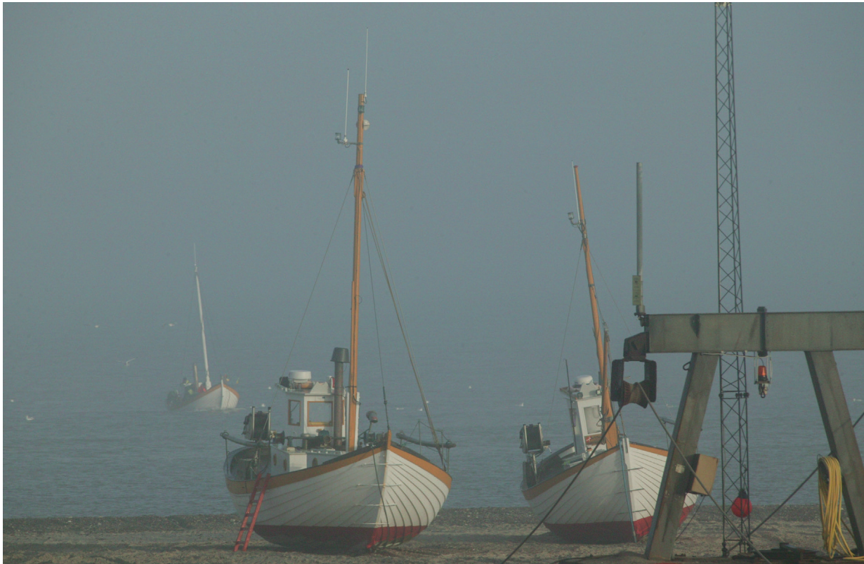
Elbo lander en diset morgen i november med en fangst sild.

1. august kunne vi endelig åbne Havbådehuset efter, coronaen havde lukket det siden november 2020. Det var godt at få liv i huset igen, og der er rigtig mange, der hen over sensommeren og efteråret har haft glæde af at komme ind at se udstillingen.