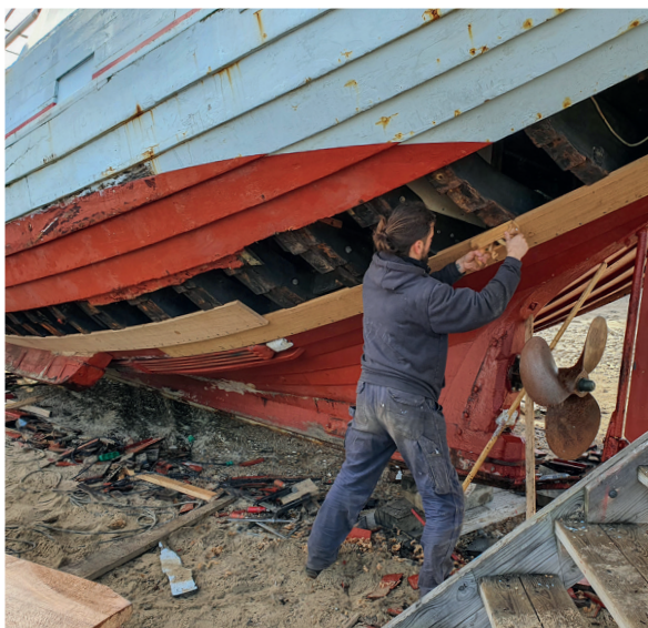
René hævler planken til.