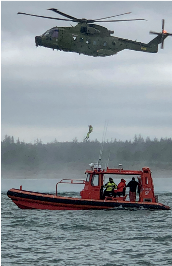
Redningsbåden fra Thorupstrand og redningshelikopteren fra Aalborg.