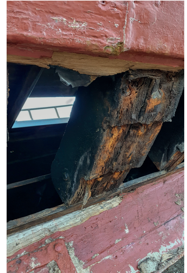
Michell er ikke helt ny længere.