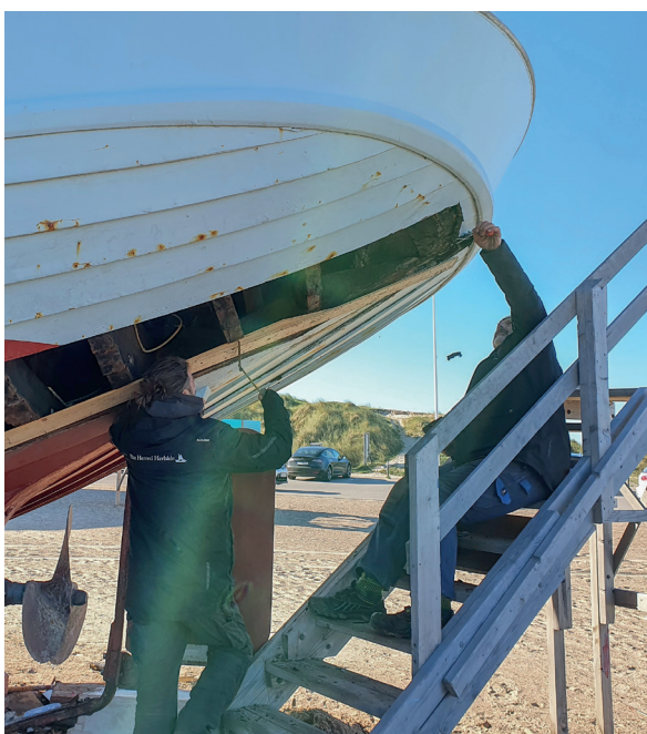
René og Peter i gang med at måle op til et bord.