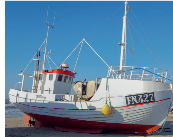
Michell i Løkken i 2019.